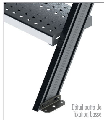
Détail patte de fixation basse